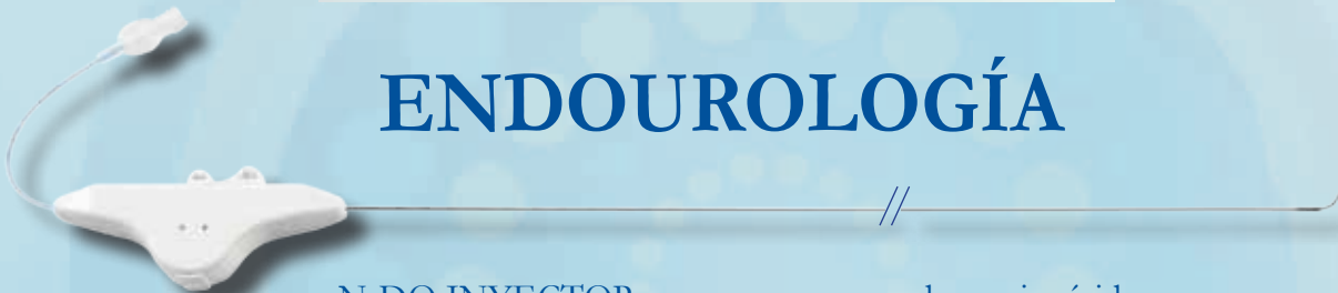
N-DO INYECTOR para su uso con endoscopio rígido